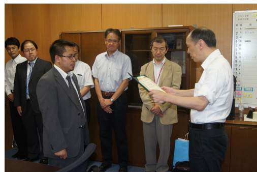
BWEL fall certification ceremony 修了証授与式（秋期）の様子

平成 26 年 11 月 2 日：岐阜大学フェアにおいて BWEL 学生による実験教室「汚れた川の水から飲める水をつくってみよう」を実施しました。