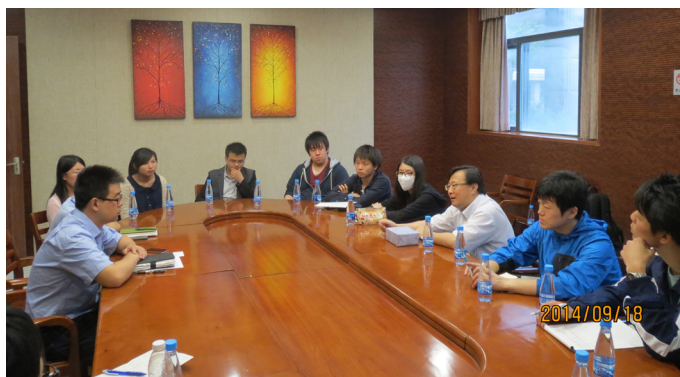
Short meeting in a water treatment plant in Nanjing 南京市上下水処理施設における意見交換会

交換を行いました。上海市内における歴史文化施設での研修では、中国の伝統や文化、風習並びに水環境問題への理解を深めました。参加者からは、「非常に有意義で実りのある活動だった」、「知識や見解を広げてくれただけでなく、中国の歴史、文化、水環境を学ぶ、そして環境リーダーとしての自覚を再認識する貴重な機会でもあった」、「今後はこの経験を生かして残りの勉学活動に励みたい」といった感想が寄せられました。