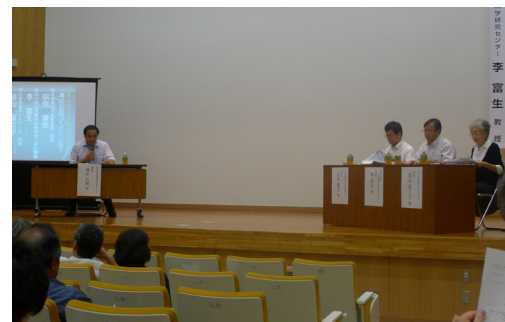
Panel discussion "Clean water environment in Gifu" by 3 experts 有識者 3 名によるパネルディスカッション 「『清流の国づくり』とは？」の様子

本シンポジウムは、(一財)岐阜県環境管理技術センター、ぎふ・水環境ネットワーク、岐阜大学みず再生技術研究推進センター、流域圏科学研究センター、岐阜大学との共催で行われました。