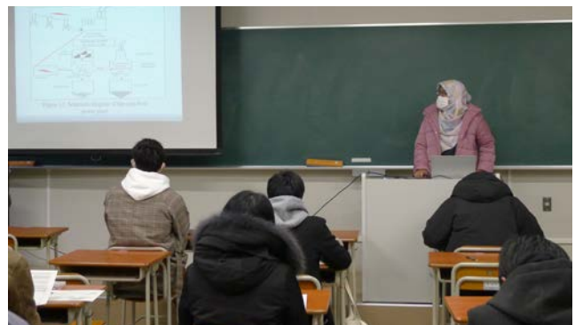
地域環境社会特論・地球環境社会特論/地球環境セミナーIにおける学生による発表 Presentation by students in Regional Environment Social Studies・Global Environment Social Studies / Global Environmental Seminar I