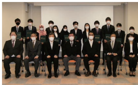
修了式の集合写真 Group photo of the BWEL certification ceremony

7名の留学生修了生のうち2名は岐阜大学の博士課程に進学します。2名は帰国前に岐阜大学流域圏科学研究センターで研究員として研究を続けます。その他の留学生修了生は就職活動や進学に向けた準備を行います。