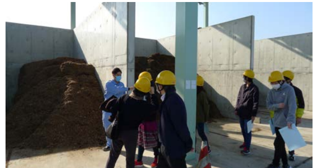
環境リーダー育成特別演習における現場学習の様子 Scene of on-site study in Special Practice for Rearing Environmental Leaders