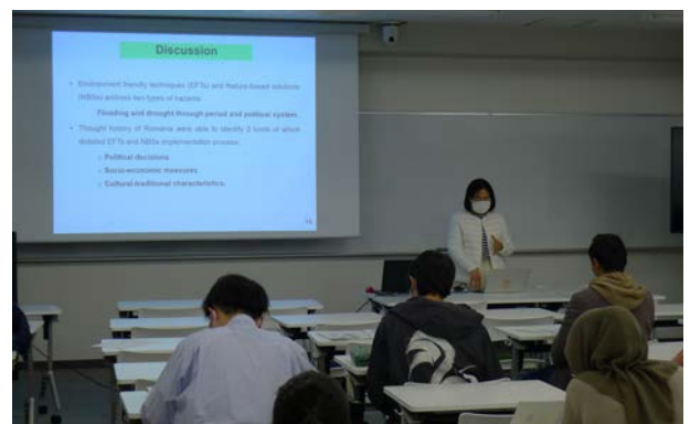
環境ソリューション特別演習 I における学生による発表 Presentation by students in Environmental Solution Special Practice I