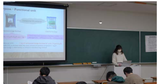
環境リーダー育成特別演習におけるグループ発表 Group presentation in Special Practice for Rearing Environmental Leaders