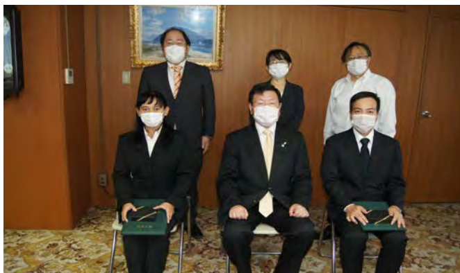
修了式の集合写真 Group photo of the BWEL certification ceremony