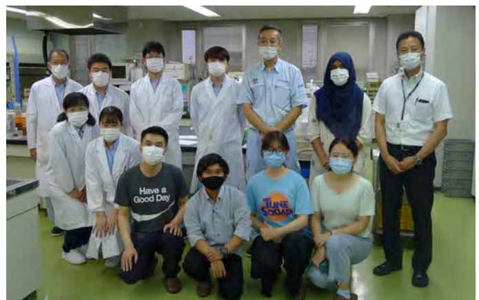
Group photo with staff of the Gifu Environmental Management Technology Center (一財) 岐阜県環境管理技術センターの職員との記念撮影

このグループインターンシップは学生たちにとって浄化槽といった戸別汚水処理技術を理解するとともに、実際の水質分析業務を経験する良い機会となりました。この経験を将来、母国の水環境問題解決に役立ててくれることを期待します。