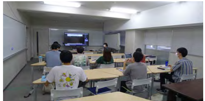
The overseas internship using online conference system オンライン会議システムを用いた海外グループインターンシップ

it will be possible for students to learn more about the situation overseas while keep staying in Japan. Further progress in international education can be expected.