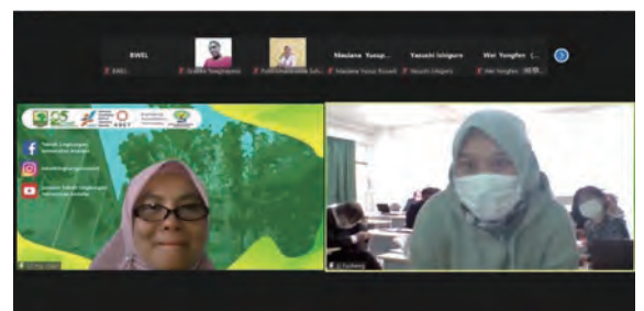
Presentation (top) and discussion (bottom) using online conference system オンライン会議システムを用いた講演（上段）と討論（下段）