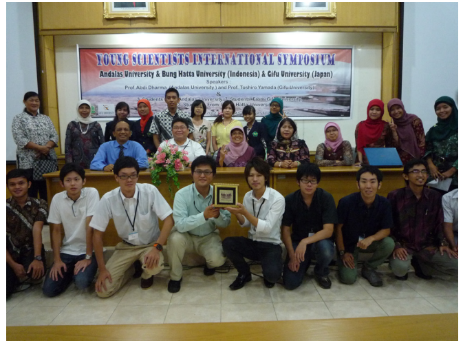
国外インターンシップの一環としてアンダラス大学において開催された若手シンポジウムの集合写真。アンダラス大学、ブングハッタ大学、岐阜大学の若手研究者、大学院生が参加した。Photo from Young Scientist Symposium held at Andalas University held as a part of the overseas internship. Young researchers and graduate students from Andalas, Bung Hatta, and Gifu universities exchanged their idea on environmental problems.