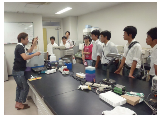
高校生・高専学生へ向けた研究室見学の様子(水質安全研究室) Lab tour for high school and undergraduate students (Water Environment Research Lab)