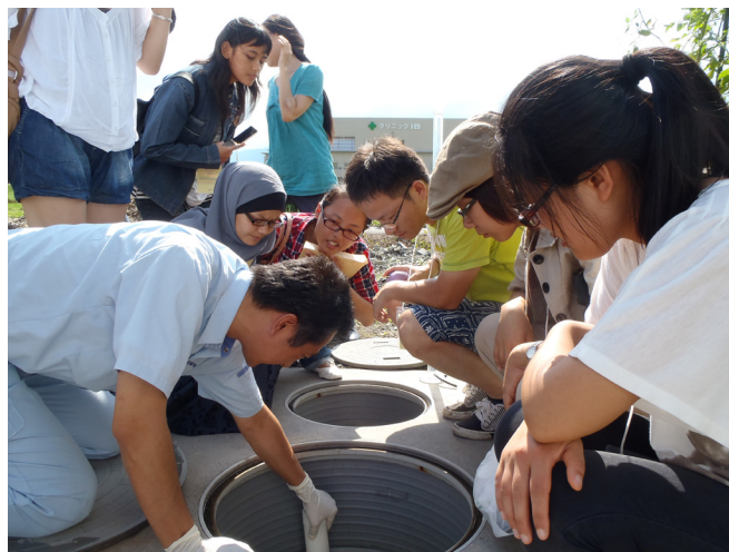
国内インターンシップで行われた浄化槽の水質サンプリングの様子。岐阜県環境管理技術研究センターの職員による実際の作業を熱心に見入る。 Photo of water sampling from Johkasou. BWEL students stare at the demonstration done by the expert from Gifu Environment Management and Technology Center.

tunities to learn situation that a developing countries are confronted with through discussion and communication with local government officers and students.