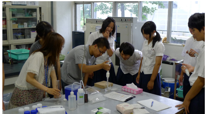
水環境リーダー育成プログラム学生による高校生に対する水質分析指導の様子 Instruction of chemical analysis of water samples for high school students by BWEL students

ました。10名の高校生が参加し、「留学生に接し、普段の授業ではできない貴重な体験で、また参加したい」や「水の大切さを改めて感じた」、「これからも水について詳しく学んでいきたい」といった感想をいただきました。参加した水環境リーダー育成プログラム学生にとっても普段接することのない高校生との交流は、環境教育の現場を知るとともに、さらなるリーダーシップ養成に寄与するとともによい機会となりました。